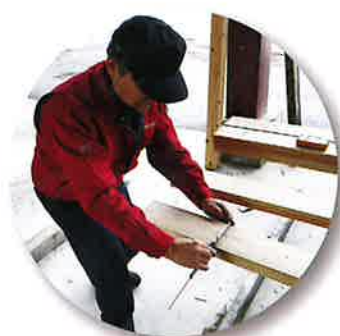
JAS 格付け検査 (寸法測定状況)