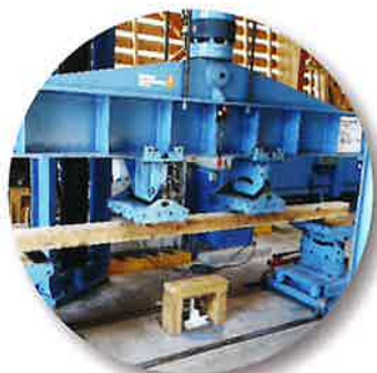
JAS 構造材 曲げ強度測定