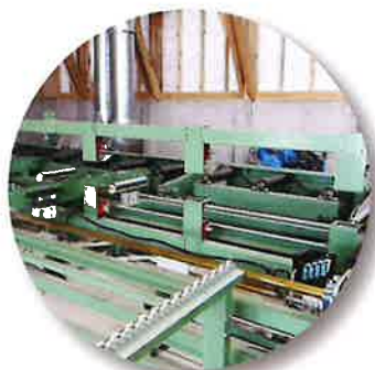
グレーディングマシン (強度測定器)