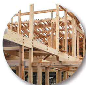
構造躯体状況 (柱・梁)